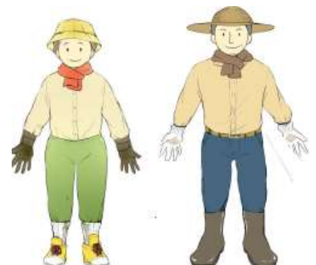
ダニの吸着を防ぐ服装