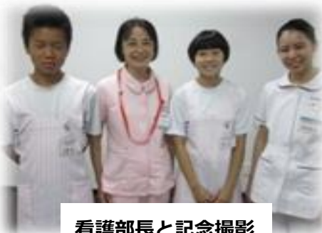
看護部長と記念撮影