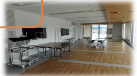
レストラン・ラウンジ（7階）