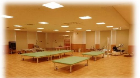
リハビリテーションセンター（5階）