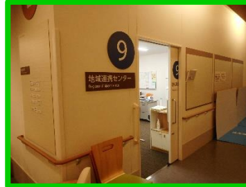
地域連携センター（1階）